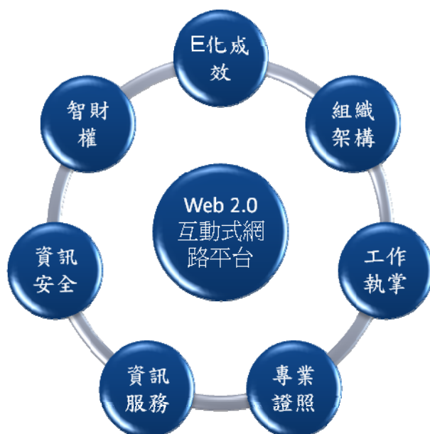
圖 1.2 Web2.0 互動式網路平台