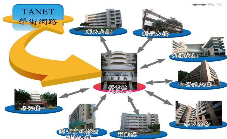
圖 1.3 校園網路示意圖